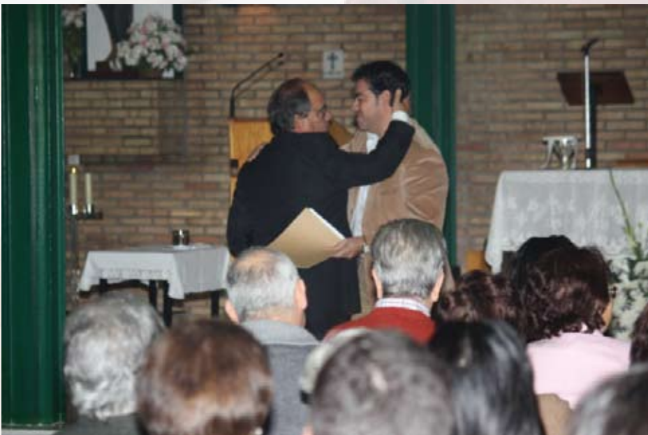
Padre e hijo, exaltadores de nuestra titular, Santa Ángela de la Cruz.

Y desde estas humildes letras, quiero agradecer de nuevo y mil veces más a todos y a cada uno de vosotros, los que estuvisteis allí presentes, que fuisteis muchos y los que no pudisteis estar por diversas circunstancias pero que os sentía en el corazón, sobre todo a ti, hija mía. Siendo así, desde los momentos previos a comenzar la exaltación, ya percibía ese calor y cariño que me hizo navegar con cierta melancolía pero con total transparencia a través de mis sentimientos y propias experiencias.