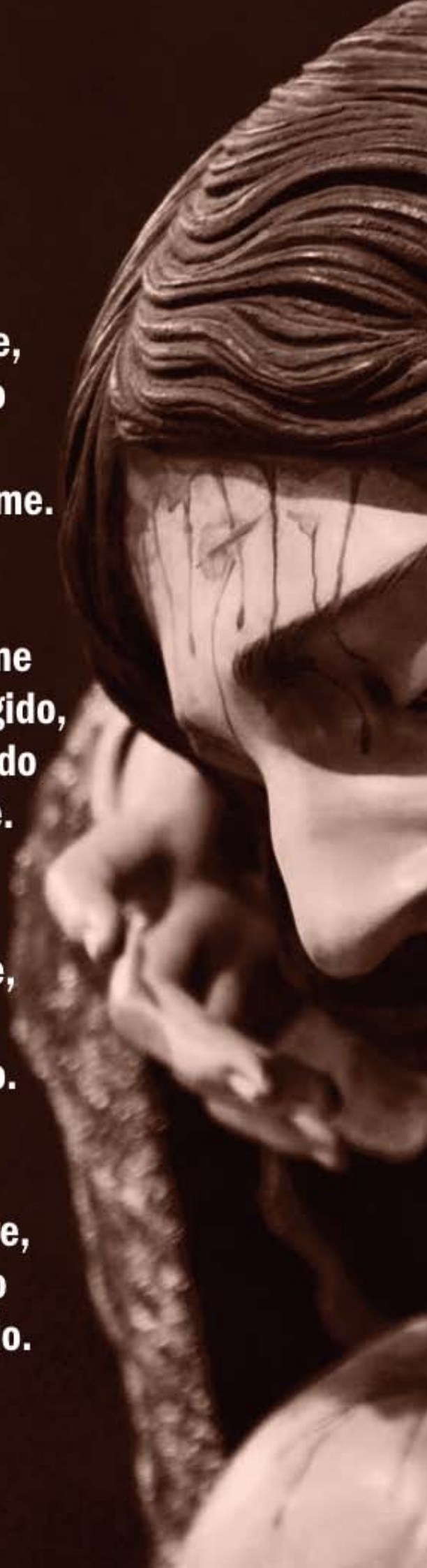
Imagen: D. Fullerat Texto: F. Illescas

Nada quebrante el digno encuadre, Mortaja mejor nunca ha existido que el alma que te hubo concebido.